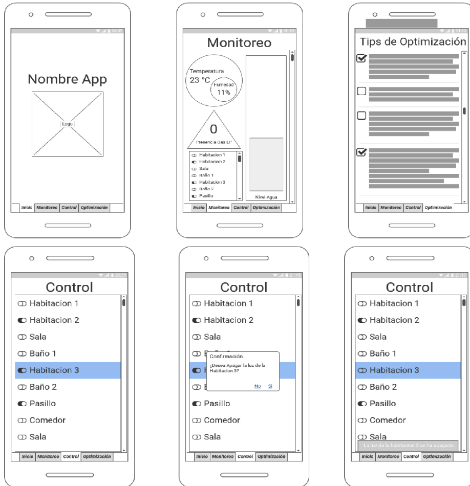
Fig. 4. Diseño de la aplicación móvil.