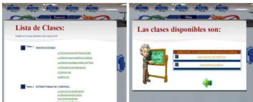
Fig. 3. Pantalla de las clases de aprendizaje de la materia de MP en el Sistema educativo.

El Sistema educativo tiene programadas las clases de todo el curso (ver Fig. 3), permitiendo al alumno seleccionar la clase de aprendizaje que desea aprender o repasar.