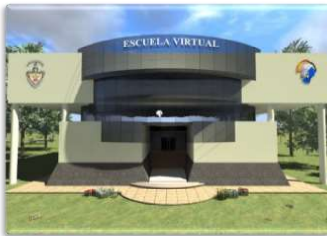
Fig. 1. Entrada al Sistema educativo para el aprendizaje de la materia de MP.

En la Fig. 1 se observa que el usuario tiene acceso al Sistema educativo a través de links que le permitirán irse desplazando por todo el Sistema.