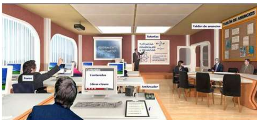
Fig. 2. Dentro del aula en el Sistema educativo.