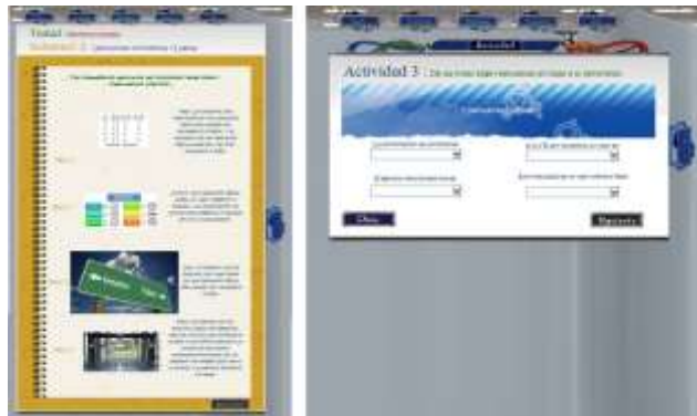
Fig. 5. Pantalla de una clase de aprendizaje y su actividad de opción múltiple.

En caso de que el alumno falle en su respuesta, se determinó que no se le puede decir literalmente que no tiene validez, así que en los dos tipos de respuesta, correcta o no, se guiará con un tip de apoyo para aclararle cual camino era el indicado, esto sin darles la respuesta, simplemente como una idea que despejará sus dudas y motivando a continuar con el curso.