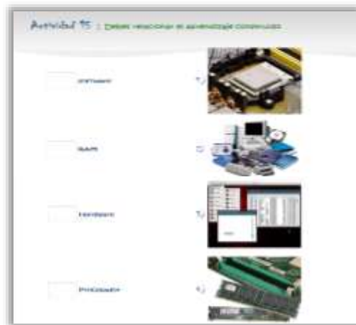
Fig. 6. Pantalla de una actividad de relacionar el concepto con la imagen.

Se intenta provocar, para que cuestionen los conocimientos que ya tiene y se esfuerce por adquirir los que aún no domina. En el momento de contestar acertadamente el concepto, se le aumentará los puntos que le corresponden y se le motivará con un tip de apoyo para complementar su conocimiento. El sistema trata de aumentar la autoestima en el momento que se le facilite y realice correctamente las actividades.