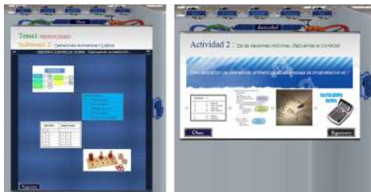
Fig. 4. Pantalla de una clase de aprendizaje y su actividad de aprendizaje de la materia de MP en el Sistema educativo.

El Sistema educativo tiene programadas las actividades en ambientes virtuales para el aprendizaje (ver Fig. 4), en donde los estudiantes reciban una instrucción y al mismo tiempo son partícipes de ella jugando un rol activo para fomentar la colaboración de los mismos y enriqueciendo el acervo que el sistema ofrezca para dicho aprendizaje.