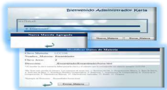
Fig. 7. Pantalla de alta de un curso en la cuenta del administrador en el Sistema educativo.

El administrador puede dar de alta alumnos, profesores, materias y actividades de aprendizaje (ver Fig. 7), el acceso es mediante una clave.